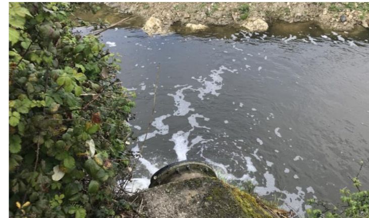
Photographie du point de rejet des eaux traitées