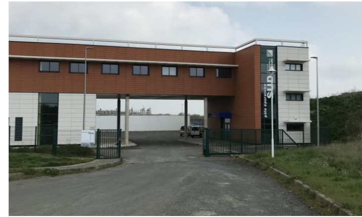
Prise de vue de l'entrée de la station d'épuration