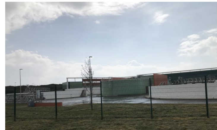
Prise de vue des ouvrages de traitement depuis la limite Nord de la parcelle d'implantation