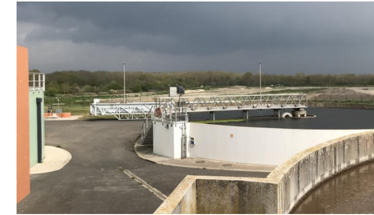
Prise de vue depuis le bassin d'aération