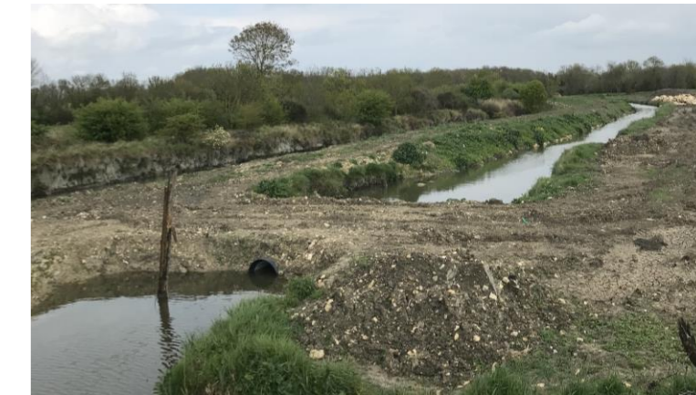
Prise de vue du marais en amont du point de rejet des eaux traitées